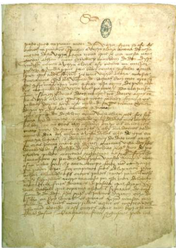
Carta de Pêro Vaz de Caminha. 1 de Maio de 1500. Portugal, Torre do Tombo, Gavetas, Gav. 15, mg. 8, n.º 2

Ainda antes da apresentação da tabela com a sequência de sessões de leitura , impõe-se expor, a título de exemplo, algumas das imagens a apresentar aos alunos.